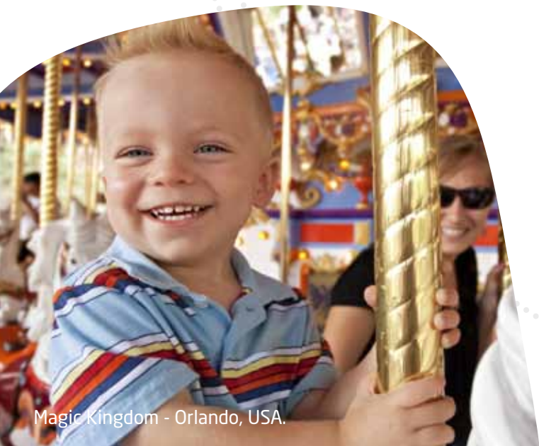
Magic Kingdom - Orlando, USA.

Café da manhã no hotel. Em horário apropriado, traslado do hotel até o aeroporto de Orlando. Nota importante: O guia brasileiro NÃO acompanha os passageiros do traslado de saída até o aeroporto. Como há muitos voos e conexões diferentes para a saída dos Estados Unidos, é possível que o guia brasileiro não permaneça na cidade neste dia até que o último passageiro embarque de volta ao Brasil. Em todo o caso, o guia dará previamente todas as informações aos passageiros sobre o traslado de saída.